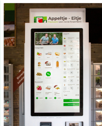
De winkels van Appeltje - Eitje in Arnhem en Lent.